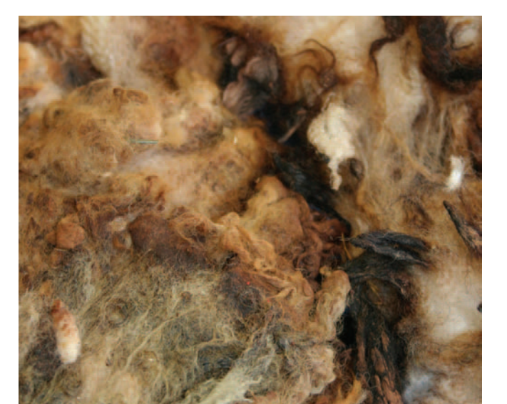
Lana con tracce di urina