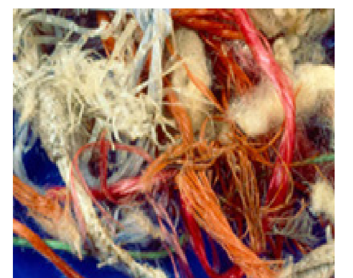
Lana mista a lacci